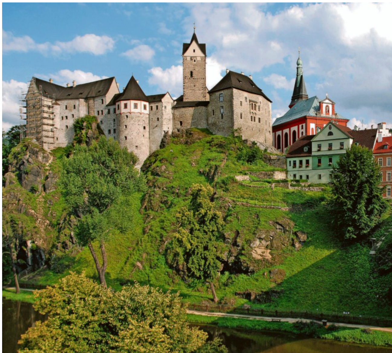
So pittoresk wie ein Gemälde von Spitzweg: das Städtchen Elbogen hoch über der Eger

Spinnennetze scheinen das Ganze zusammenzuhalten. Vor allem aber stellt sich die Frage, wie man in die Kirche hineinkommt? In den drei Häusern, die vom alten Dorf geblieben sind, scheint kein Mensch zu sein. Wir streifen über den Friedhof, auf dem noch viele alte deutsche Grabsteine stehen. Hier, unter den Toten, finden wir sie, die ehemaligen Bewohner, die „Hofbesitzer“, „Kaminkehrermeister“ und „Dorfschullehrer“. Und dann passiert das Wunder: Aus dem Nichts taucht ein Mann auf, öffnet mit seinem Schlüssel das Kirchentor und verschwindet wieder. Eine strahlend helle Barockkirche nimmt uns auf, die eben erst fertig geworden zu sein scheint. Wir sehen staunend die ungeheuer realistischen Fresken, die in vier großen Deckenmedaillons das Martyrium des heiligen Bartholomäus zeigen. Bei all dem Staunen hätten wir fast unseren Pförtner vergessen, der inzwischen mit einer Gitarre am Altar Platz genommen hat und versunken zu spielen beginnt. Von nun an nimmt ein herrlich versponnener Nachmittag seinen Lauf, den wir in dieser Einöde niemals erwartet hätten.